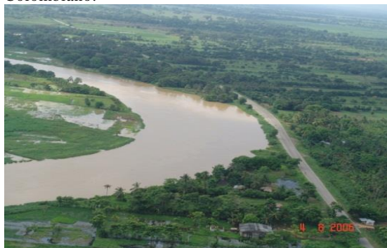
Fotografía 2.- Río Sinú en Trementino tres años después de instalado el campo de paneles sumergidos.

La Fotografía 2 presenta la situación en Trementino tres años después de ejecutada la obra, condición estable que permanece desde entonces, tiempo durante el cual no se ha hecho mantenimiento alguno, generándose así ahorros adicionales para el Estado Colombiano.