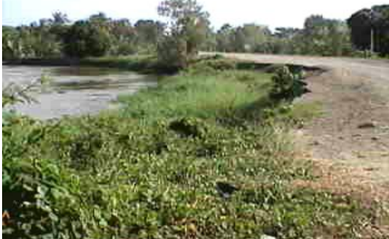
Fotografía 1.- Condición del río a septiembre de 2003: Media banca de la carretera destruida por la erosión.

Por muchos años, en especial durante los períodos de invierno, la carretera Lorica - San Bernardo del Viento fue afectada por los procesos de erosión causados por el río Sinú sobre su margen izquierda en el sitio Trementino (Fotografía 1), con afectación directa sobre el tránsito de vehículos de carga y de pasajeros, y notorio efecto sobre la economía regional, en particular la de origen turístico.